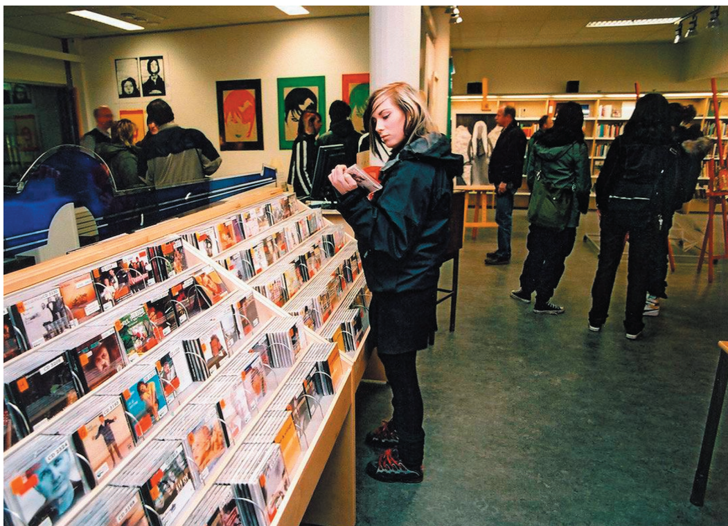
Ung Konst & Scen, en konståvling för lokala ungdomar, på Visbiblioteket i Västervik.