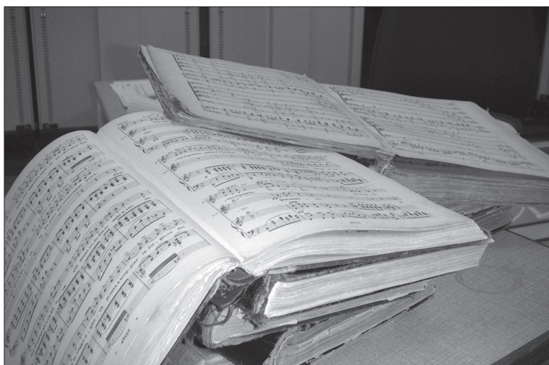
Gamla slitna klaverutdrag, ibland med inskriven svensk text till de kändaste ariorna

Med andra ord: smörgåsbordet är dukat och meny utökas dagligen så välkommen att glänta på locket till T-klav-samlingens skatter genom att söka i onlinekatalogen på vår hemsida www.muslib.se