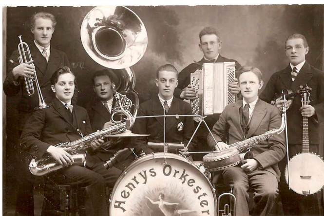
Henrys orkester från Alstermo spelade till dans på 1920.

Smålands Musikarkiv utgör numera en relativt självständig del inom Musik i Syd, men var tidigare en basenhet under länsutvecklingsavdelningen inom Landstinget Kronoberg. Den gamla anknytningen finns kvar genom att arkivets databaser och övriga IT-hantering hanteras av landstinget. Arkivsamlingarna i sig ägs också fortfarande av landstinget.