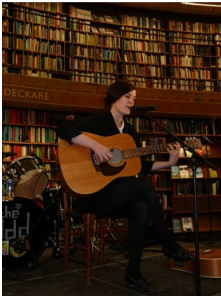
Promise and the Monster.

-Nästan alla besökare och personal tyckte att det var en kul idé med konsert under öppettiden. Några i personalen var oroliga eftersom det kom så många, cirka 300 personer per konsert. Hur skulle vi göra vid en plötslig utrymning? Men alla visade god vilja. Detta med säkerheten löser vi till nästa gång. För vi planerar för en fortsättning till hösten och då ska vi satsa mer på att blanda in biblioteket i form av boktips, säger Sarah och Carolin. Många andra bibliotek har blivit intresserade av idén. Både i Finland (Library ten i Helsingfors) och i England finns det bibliotek med rockkonserter bland böcker och besökare.