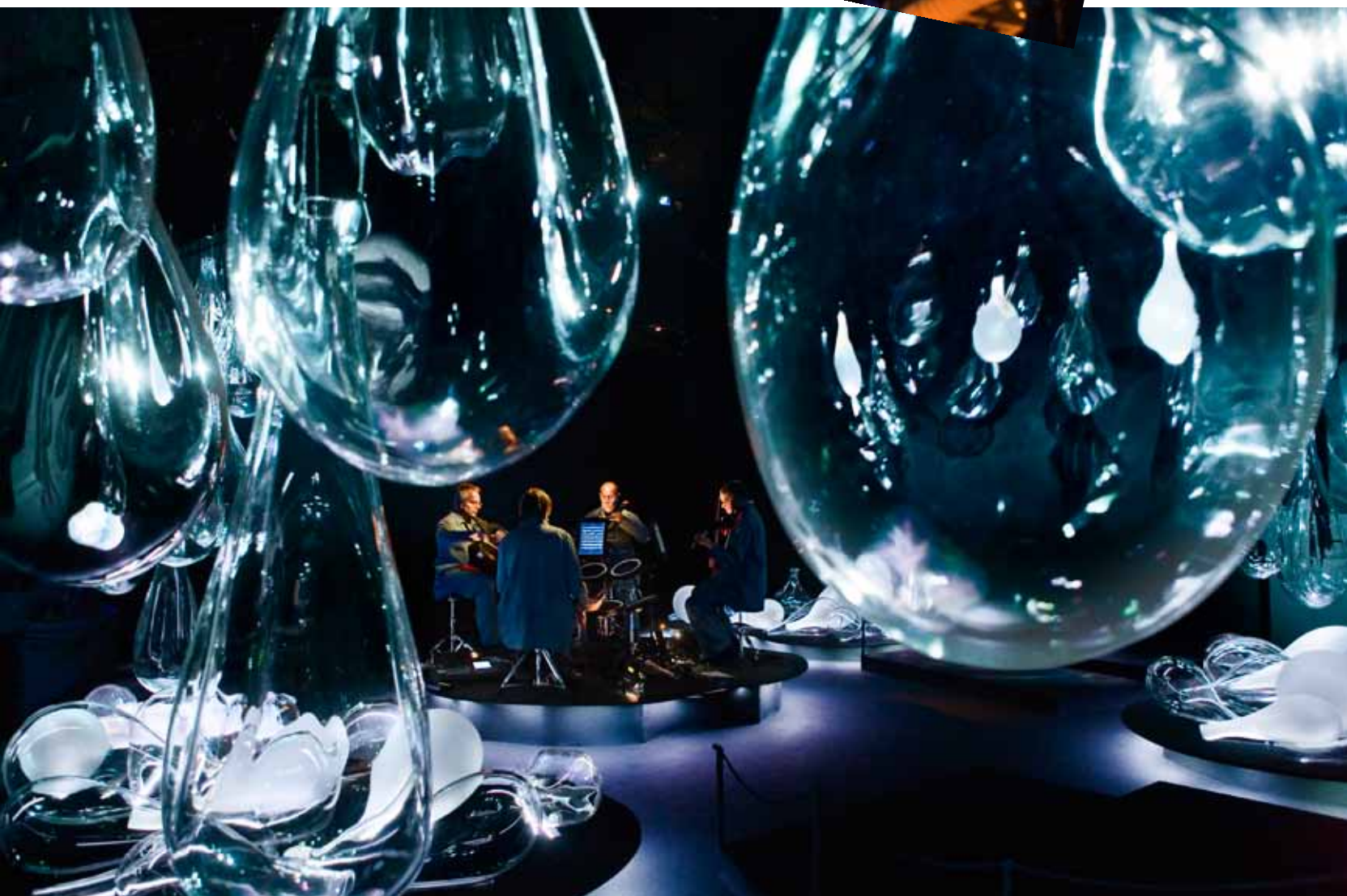
Different trains med elektroniska notställ.