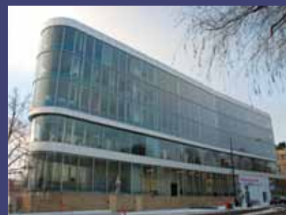
Musik- och teaterbiblioteket på Torsgatan.

Nu har Statens musikbibliotek bytt namn till Musik- och teaterbiblioteket. Teatermuseets böcker med Libris-sigel Dtm kommer ni att kunna låna från biblioteket på Torsgatan. Sigeln för Musik- och teaterbiblioteket blir som förut X.