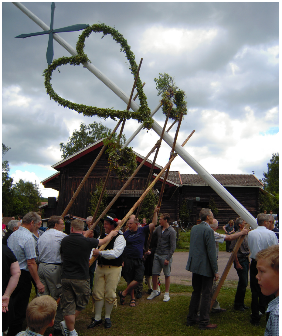
Hör Sveriges midsommartraditioner till det immateriella kulturarvet?

Bakgrunden är en konvention om skydd av det immateriella kulturarvet som Unesco antog år 2003 och som trädde i kraft 2006 då 30 länder hade ratificerat den. Hittills har 117 länder ratificerat konventionen. Unesco (United Nations Educational, Scientific and Cultural Organization) bildades 1945 och är ett av FN:s 15 fackorgan. Unesco har som syfte att verka för fred och säkerhet genom att främja internationellt samarbete inom utbildning, vetenskap och kultur. Immateriellt kulturarv kan vara danser, sånger, ritualer, traditioner, sedvänjor, muntlig berättartradition, hantverk och färdigheter, sådant som