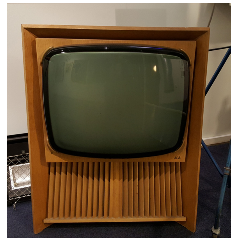
TV från förr.

Jazzmusiker som kan nämnas är Bengt Egerbladh, Anders Ekdahl, Lars Gullin, Bengt Hallberg som alla dyker