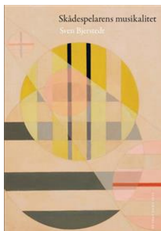
Skådespelarens musikalitet / Sven Bjerstedt Gidlunds förlag 2017