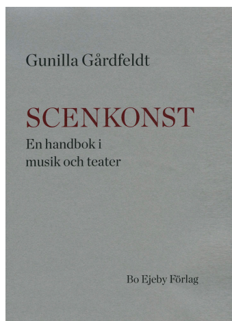
Scenkonst: en handbok i musik och teater / Gunilla Gårdfeldt Bo Ejeby förlag 2017