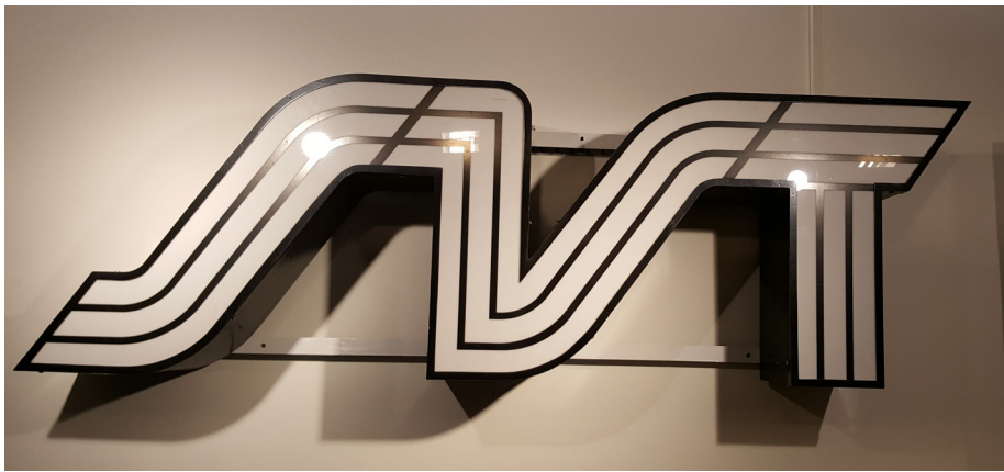
SVT:s logga från förr.

1988 – Pappa Voglers pomeranser och sen på 1990-talet skrev han musiken till Den goda viljan 1991 och 1996 till Jerusalem i regi av Bille August.