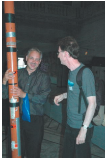
Artikelförfattaren och en norsk näverlurblåsare i samspråk under mottagningen på Oslo rådhus.