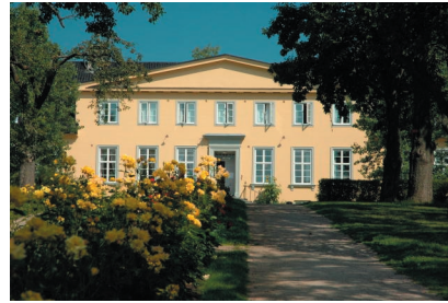
Blindern studenterhjem, där många av de svenska delegaterna bodde.

data banks”. Här var de intressantaste föredragen Christiane Hofers rapport från projektet ”Firmen- und Künstlerdiskographien der Schellackzeit” och Vidar Vanbergs presentation av ”Early sound recordings and discography in Norway”. Det senare, något ovanligt i dessa power point-tider, presenterat med hjälp av overhead!