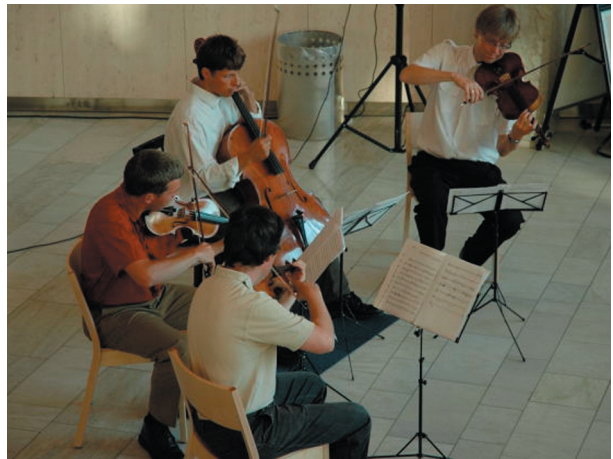
Bilder från Oslo, tagna under IAML-konferensen i augusti 2004.