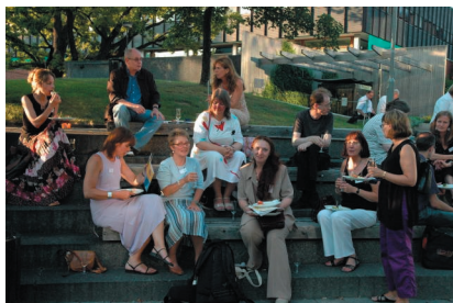
Ett gäng svenska musikbibliotekarier utanför Universitetsbiblioteket (Georg Sverdrups hus) på öppningsceremonikvällen.

Jag anlände med tåg till Oslo sent på söndagseftermiddagen. Solen strålade och värmen var tropisk (och skulle så förbli hela veckan). Jag beslöt mig för att ta mig till fots till hotellet, som låg ganska centralt i närheten av slottet. Lade märke till att det var fler tiggare längs Karl Johan än senast jag var i Oslo för ca sju år sedan. Efter en snabb incheckning på hotellet och bra tips från Gunnel Jönsson hur man kunde ta sig till platsen för kongressen gav jag mig ut i oslovimlet.