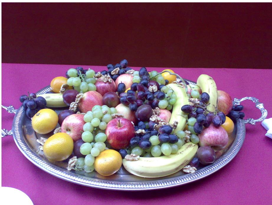
Vackert fruktfat som serverades strax innan föreläsning.

P å Kungliga biblioteket i Stockholm ordnade HISS (Humaniora i Stockholms samverkar) en föreläsning om doldisar i arkiven den 7 oktober.