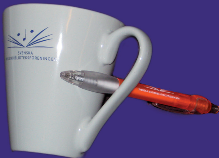
Mugg 50:- (pennan kan inte köpas, endast erövrats!)