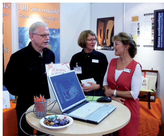
Kulturminister Lena Adelsohn Liljeroth på besök