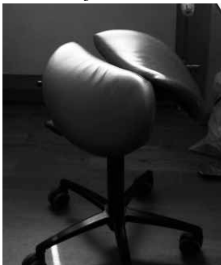
Den ergonomiska stolen.

Konserthuset var ritat på 1930-talet för kammarorkester så numera känns det lite trångt. Det är ont om plats såväl på scenen som på instrumentförrådet. De byggde därför en utvidgning av scenen just då när vi var på besök. Det var intressant att gå bakom kulisserna, vi