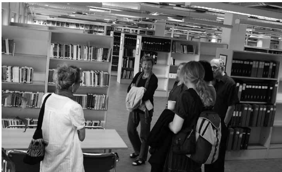
Visning av Malmö musikhögskolebibliotek.

||| Judit Schöld, Kungl. Musikhögskolan i Stockholm, Biblioteket