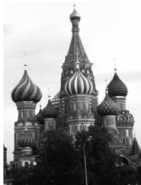
Vasilijkatedralen på Röda torget.

Diskussionen som följde kommer säkert att beskrivas mer omfattande i de officiella rapporter som kommer efter kongressen, men i korthet handlade de flesta diskussionsinläggen om följande: Vad kan man förvänta sig av ett medlemskap, hur värvas yngre deltagare till konferenserna, vad är IAML:s webbsida till för, hur utnyttjas budgeten, arbetar man med relevanta frågor, hur ska aktiviteten på IAML-L öka? I sådana här diskussioner handlar det ju inte bara om att var och en ska