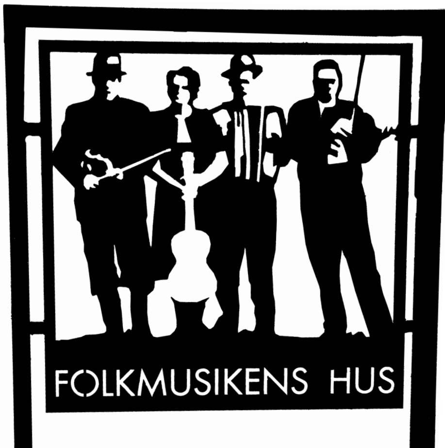
Skylten för Folkmusikens hus.

Rötterna fanns i USA från slutet av 1970-talet. Ungdomarna hade X-märken på händerna; ursprungligen betydde det att man var för ung för att få handla i baren. X-märket kom att bli en symbol för livsstilen straight edge. Scenen i Umeå var oftast ungdomsgården Galaxen. Politiskt aktiva satte 1994 Scans lastbilar i brand. Debatten i lokalpressen var het med anklagelser om att Straight edgerörelsen hade uppvisat ungdomar till att göra detta.