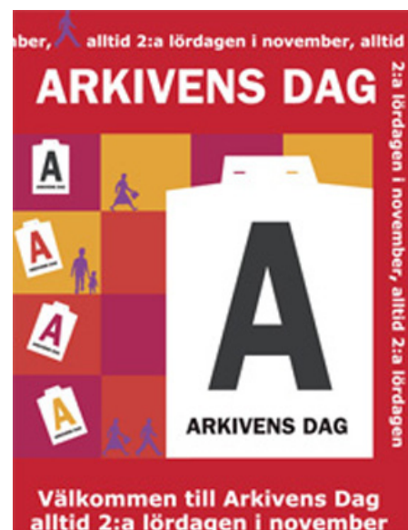
Affischen för Arkivens dag.