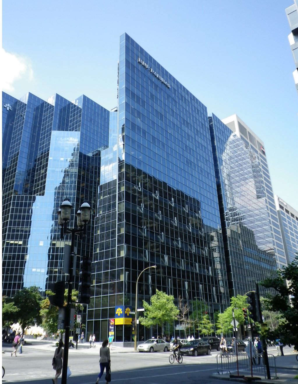
Skyskrapor på vägen till studiebesöket på Canadian Music Centre.

Punkt två var Terry Horner som presenterade British Columbia Sheet Music Project (University of British Columbia, Vancouver, BC). Detta är en samling av cirka 170 stycken noter från och om regionen British Columbia från 1868 fram till idag, om orter, trakter, enskilda personer och myter som sången om den berömda Ogoopogo, ett sjödjur liknande det i Loch Ness. Webbplatsen ger också mycket information om projektet i allmänhet. Sammantaget bevarar projektet inte bara en del av regionens musikhistoria utan presenterar en social och kulturell syn sedan kolonialtiden speglat genom mestadels populärmusik. Noterna finns inskannade och musiken kan man lyssna på genom MIDI-ljud-