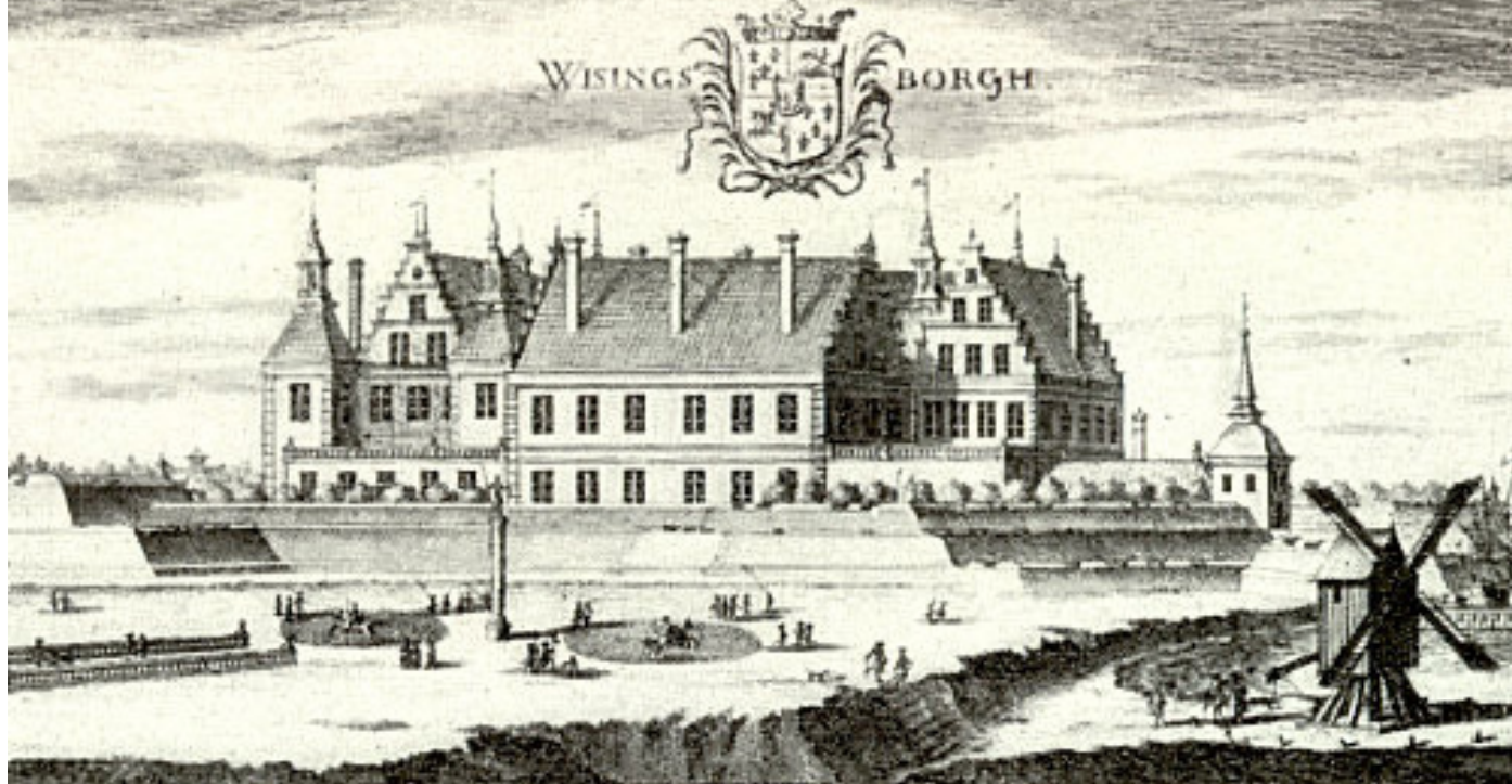
Väggmålning på Bogesunds slott.

spelade rimligtvis efter noter som trycktes på olika orter i Tyskland och innehöll lösligt sammansatta sviter av danssatser, men några sådana finns inte bevarade, endast en inkösuppgift från 1672 i Stockholm på ”6 St Spelle böcker”. Det finns gott om inkösuppgifter av instrument, främst stråkinstrument, och strängar till dem.