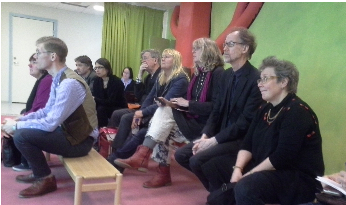
Andäktig publik till "Knackar på".