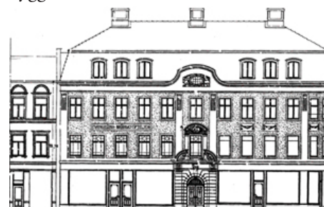
Bilden visar fasaden till Brödräfsamlingens fastighet i Göteborg såsom den kom att se ut efter den om- och tillbyggnad 1910. Göteborgs stads byggnadskontor.

Brödräfsamlingen i Göteborg är belägen på samma adress, Kungsgatan 45, som den ursprungliga om än fastigheten på grund av en brand 1802 inte är densamma. Bilden visar det utförande fastigheten kom att få efter om- och tillbyggnaden 1910.