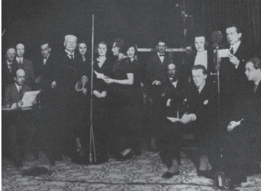
Bild från inspelningstillfället 1925 av Det gamla spelet om Envar (ur Gunnar Hallingbergs bok Radioteater i 40 år, 1965 fotograf okänd).

är ett stort antal scener som löper utan paus eller anmälan om scenförändring. Istället använder Bergman musikinslag som övergångar, och han har lagt ner möda på att föreskriva musikens art och funktion i de olika fallen. Natten till den stora [examens]dagen utformar han till en drömartad röstsekvens mot en musikbakgrund.”