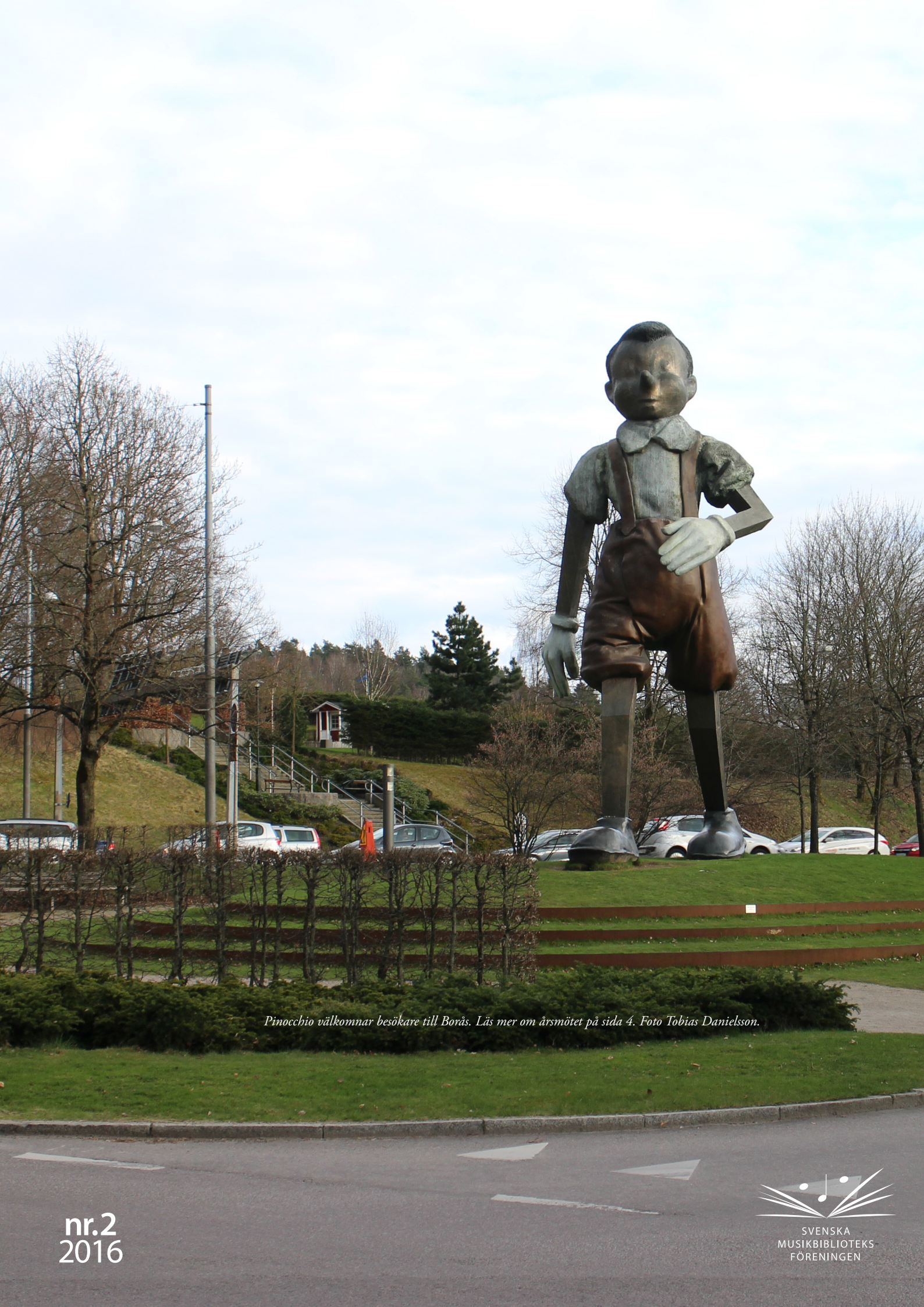
Pinocchio välkomnar besökare till Borås. Läs mer om årsmötet på sida 4.