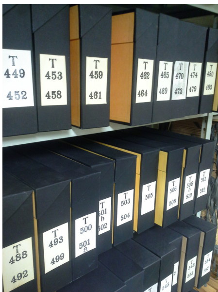
I radiohusets källare står boxarna rad på rad.

I en arkivlokal i en avlägsen korridor på nedre botten i Radiohuset finns det en samling svarta boxar numrerade från 1 till 688. Siffrorna föregås av ett T – för teater. Detta är notmaterial till pjäser som spelats in av framför allt Radioteatern på Sveriges Radio. Arkivlokalen tillhör idag Sveriges Radio och Sveriges Radios Förvaltnings AB Research & Musik – där arkivmaterialet hanteras av musikbibliotekarierna. Delar av materialet kommer att bli sökbart i Levande muskarvs databas.