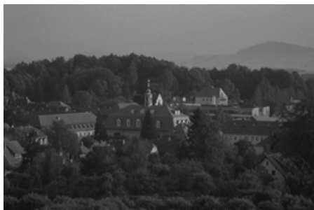
Bilden visar vy över orten Herrnhut sett från Hutberget. I mitten skimtar Brödrasalens (kyrkans) tak och klocktorn.

Samfundet Evangeliska Brödräfsamlingen (ursprungligen ”Evangelische Brüdergemeine”) härrör från 1720-talet och den lilla orten Herrnhut i östra Tyskland, som kom att växa fram på greven Nicolaus von Zinzendorfs (1700–1760) gods. Detta skedde i samklang mellan hans egen högadliga livsstil och smak, luthersk pietism samt den fromhet som kännetecknade de religiösa flyktningar från Böhmen/Mähren inom Unitas Fratrum , den sedan medeltiden reformerade kyrkan som fick tillåtelse att bosätta sig på von Zinzendorfs marker.