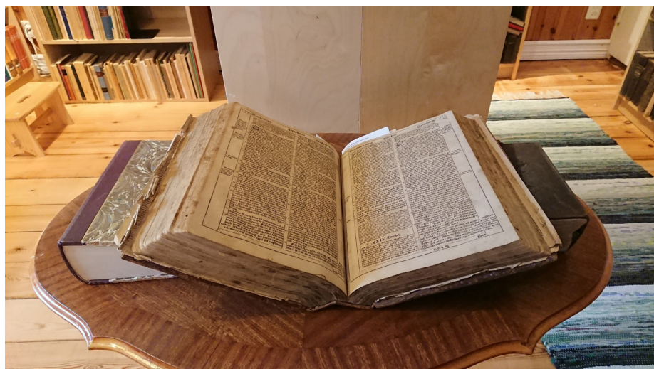
Den äldsta bibeln i samlingarna är nu 400 gammal då den gavs ut av Gustav II Adolf 1618 som en språklig översyn av Gustav Vasas bibel från 1541.

För att komma till museet kör man riksväg 63 från Karlstad mot Ludvika, Filipstad. Snart efter Alsters kyrka tar man tvärvägen mot Forshaga och strax ser man den vita vägskylt som sattes upp våren 2018 med texten "Psalmboksmuseum" och gårdsbutiksymbolen. Trots ihärdiga försök och överklaganden för att få en skylt utmed riksvägen, så blev det avslag med motivering att "resenärer förmodas planera sin resa till utflyktsmål". Att det sen är ytterst få som kan tänkas söka efter ett så udda museum bekom dem inte.