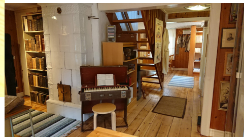
Tramporgeln går att vika ihop för att bäras iväg som en resväska, skämtsamt även kallad "snabbfrälsare".