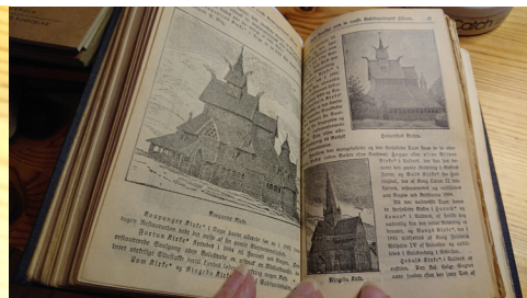
I Landstads Kirkesalmebog från 1892 kostade man på sig ordentliga kyrkobeskrivningar med 136 bilder där även de traditionella stavkyrkorna ingår. Ingen enda psalmbok i museet innehåller beskrivningar av samfundets kyrkobyggnader.