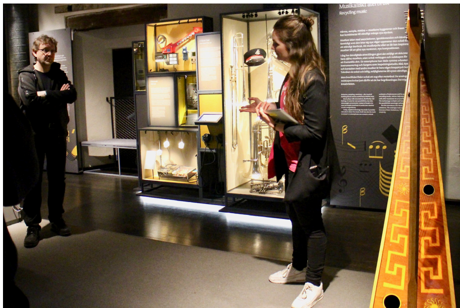
Visning av Scenkonstmuseet.

Scenkonstmuseet är ett statligt museum för teater, musik, dans, kulturarv och ingår i myndigheten Musikverket. Det öppnade i februari 2017. Museet har över 50 000 föremål i sina samlingar, men endast en bråkdel visas upp i museets lokaler. Den största delen – bland annat 6000 musikinstrument och hela Marionettmuseet – förvaras i särskilda lokaler som kan besökas efter bokning via e-postadressen: samling@scenkonstmuseet.se .