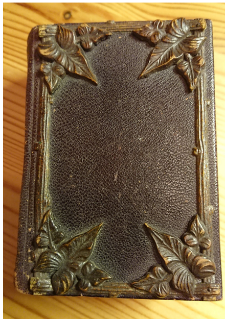
En ovanlig rikt ornamenterad psalmbok av 1819 års utgåva tryckt 1913 tryckt på Kungliga Hofbokbinderiet.