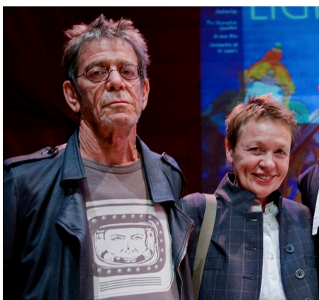
Lou Reed & Laurie Anderson.

I mars 2019 öppnade New York Public Library ett arkiv över Velvet Underground-medlemmen Lou Reed (1942–2013) för allmänheten. Det var frukten av mer än tre års arbete då Lou Reeds inte mindre berömda fru, Laurie Anderson, och några medarbetare till henne hade gått igenom rockikonens kvarläten-skap.