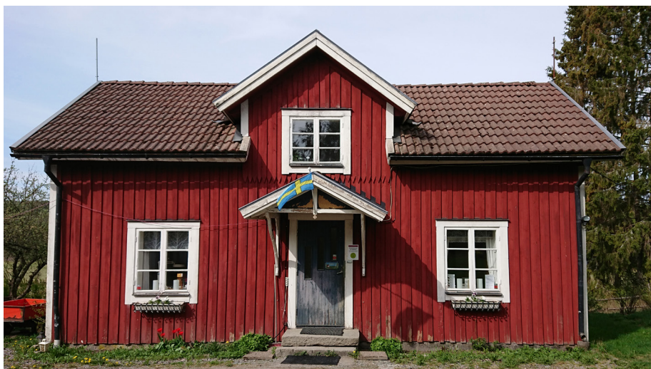
Psalmboksmuseet finns nu i smeden Magnus stuga som flyttades upp till Kroken 1905 från sin plats nere vid sjön.

Redan våren 2018 var där för trångt och gårdens Lillstuga hade blivit ledig. Med ett helt rum till förfogande kunde också fästmannens samling av gamla biblar få plats för allmän visning. Den äldsta originalutgåvan från 1618 väcker onekligen många förundran och häpnad över vad tidigare generationer åstadkom. Villfarelsen om att Karl XII:s bibel skulle vara något slags märklighet kommer också på skam då besökarna får veta att de enda originalöversättningar som skett är Gustav Vasas bibel, som följdes av endast språkliga revideringar fram till 1917 års nya översättning och den senaste i Bibel 2000.