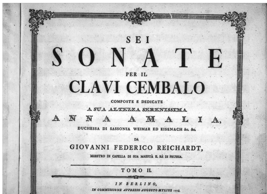
Cembalosonater från bibliotekets samlingar tillägnade furstinnan Anna Amalia.