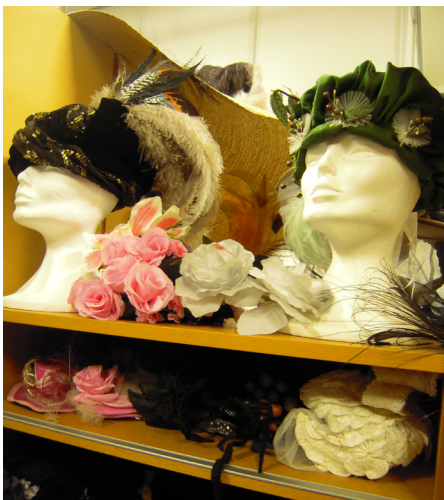
I rekvisitaförrådet hänger kläder från golv till tak. Här finns också slipsar, skor och hattar.