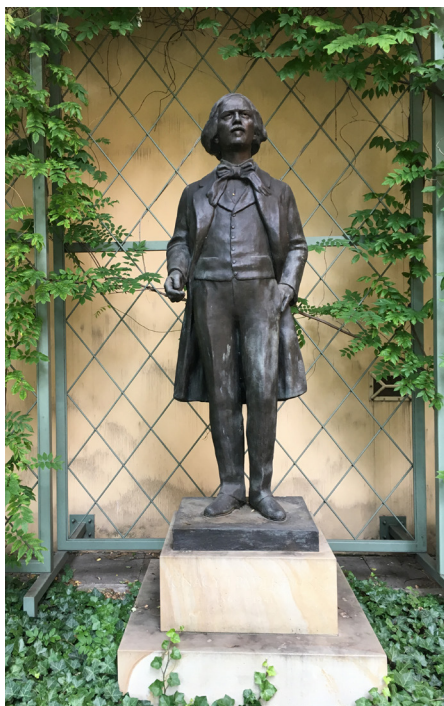
Staty utanför Paderewski center

sa var konserten i Franciskus av Assisis kyrka där en fantastisk ensemble spelade två pianokvintetter, Franz Schuberts (1797–1828) i A-dur och Józef Nowakowskis (1800–1865) i Ess-dur.