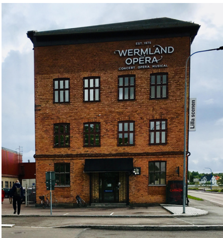
Wermland Opera är vid besöket klädd i byggnadsställningar. På bilden syns Spinneriet med Lilla Scenen.