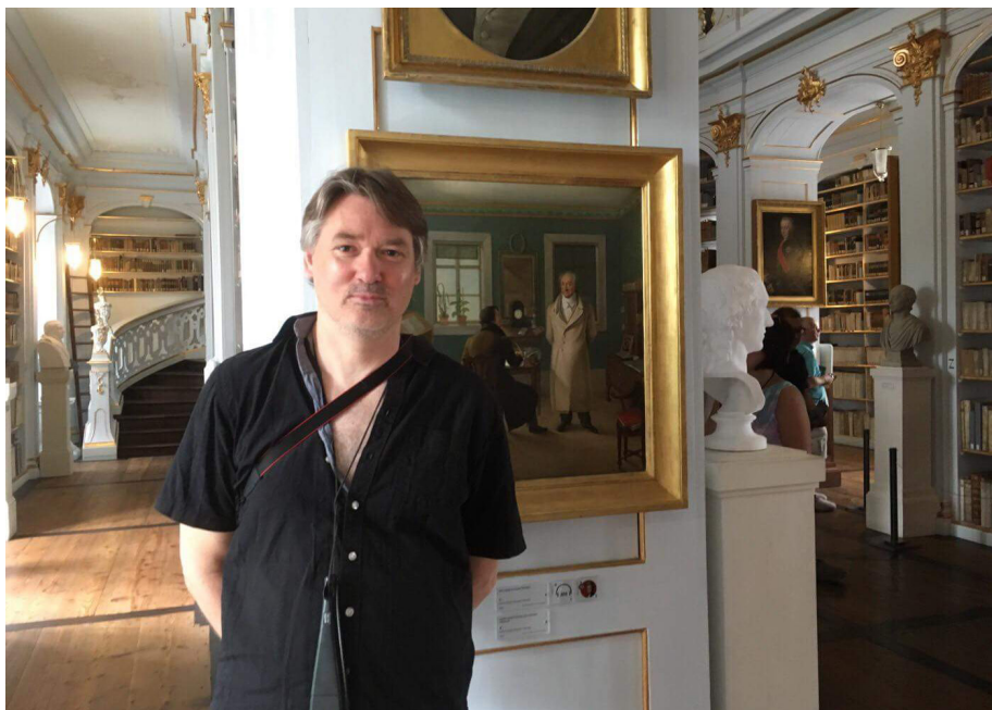
Artikelförfattaren framför ett porträtt av Johann Wolfgang von Goethe, bibliotekets "överintendent" under 35 år.

2014 brann det i ett av UNESCO:s världsarv, Anna Amaliabiblioteket i Weimar. Stora kulturella och ekonomiska värden gick förlorade och inte minst musikalierna var bland de svårast drabbade. Dock finns det lärdomar att göra av katastrofen.