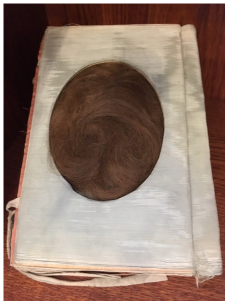
Paderewskis hår. Förutom sin bländande pianoteknik var Paderewski även berömd för sitt generösa hårsvall.