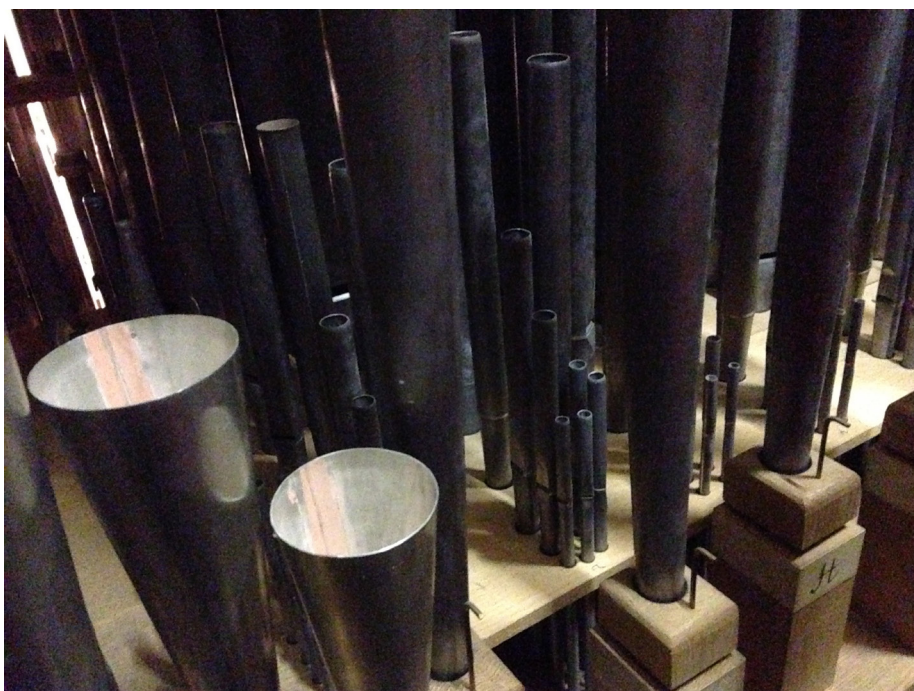
Örgryte kyrkas orgel.

Program och abstrakt till föredragen kan läsas på Svenska samfundet för musikforskning hemsida musikforskning.se