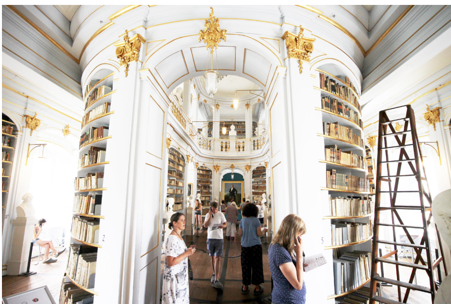
Interiörer från Anna Amaliabiblioteket.

permanent verkstad på biblioteket där man restaurerar böcker och det har även gjorts stora investeringar i brandskyddet. För att kväva bränder i sin linda har man ett system som i ett inledningsstadium avger högtrycksvatten som dimma och ett rökutslagnings-system vilket via luftens molekylära sammansättning känner av huruvida det ska reagera eller inte. Man är garanterad en grundfinansiering fram till 2028 från skattemedel och privata donationer och fram till idag har man ersatt drygt 80% av det förlorade beståndet via nyinköp och restaurationer. Idag kommer andra branddrabbade institutioner till Weimar, till exempel Nationalmuseet i Rio de Janeiro, för att få råd och hjälp.