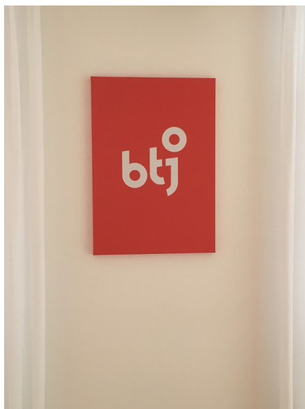
Sedan 2002 är företagsnamnet BTJ

tek”. De arbetar för att ”underlätta bibliotekens vardag genom att frigöra tid och resurser ute på biblioteken” (från BTJ:s webbplats). BTJ hjälper biblioteken med katalogisering i Libris och klassificerar numera med både SAB-koder och Deweykoder.