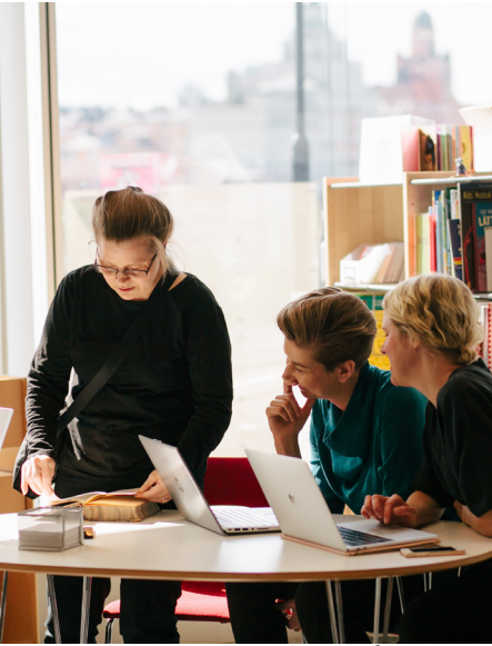
Foto från skrivstugan.