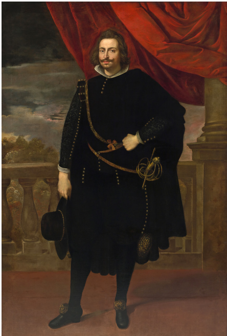
Porträtt av Fursten av Bragança, den blivande Kung João IV, i 25-årsåldern av Peter Paul Rubens.

Legenden berättar, att när den portugisiska aristokratin hade gjort uppror mot den spanska unionskungen 1640, utnyttjande det faktum att den spanska armén var upptagen i det 30-åriga kriget, och frågade den åttonde hertigen av Bragança vid namn João (engelska: John, svenska: Johan) om han ville bli kung av Portugal, ställde han sig mycket tveksam till erbjudandet. Det var inte förrän efter en flera månaders övertalningskampanj från hans hustru Luisa han verkligen blev kung över Portugal, 1 december 1640.