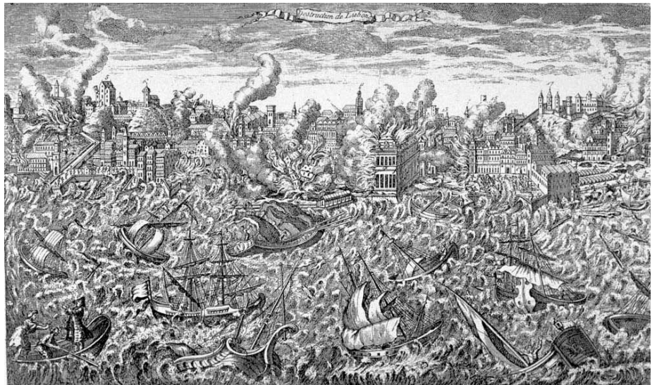
Kopparstick från 1755 som visar Lissabon i lågor och en tsunami som överraskar fartygen i hamnen.

då jag med alltmer stigande besatthet följer en rad mosaikbesatta tavlor, så kallade "azulejos", som presenterar Portugals regentlängd och historia. Tavlan som uppslukar mitt intresse handlar om Dom* João IV, där det berättas att han, förutom att vara kung och musiker, även hade grundat ett musikbibliotek! Förutom en liten skamsen harm över att ha "undflytt" min arbetsplats för att i stället bli exalterad över en notsamlande portugisisk konung på 1600-talet, kände jag nu ett begär av att veta mer och dessutom av att kanske i framtiden besöka denna musikhistoriskt betydelsefulla samling. Tyvärr visar sig detta svårare än vad jag hade trott.