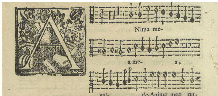
Inledningen till en sångstämman ur motetten "Anima mea turbata", komponerad av Kung João.