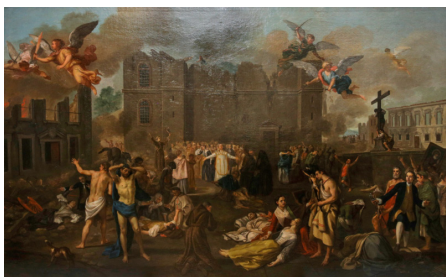
Allegori över Lissabons jordbävning 1755. (João Glama Strobërle). I övre vänstra hörnet ses en ängel med ett svärd av eld som personifierar den gudomliga rättvisan.