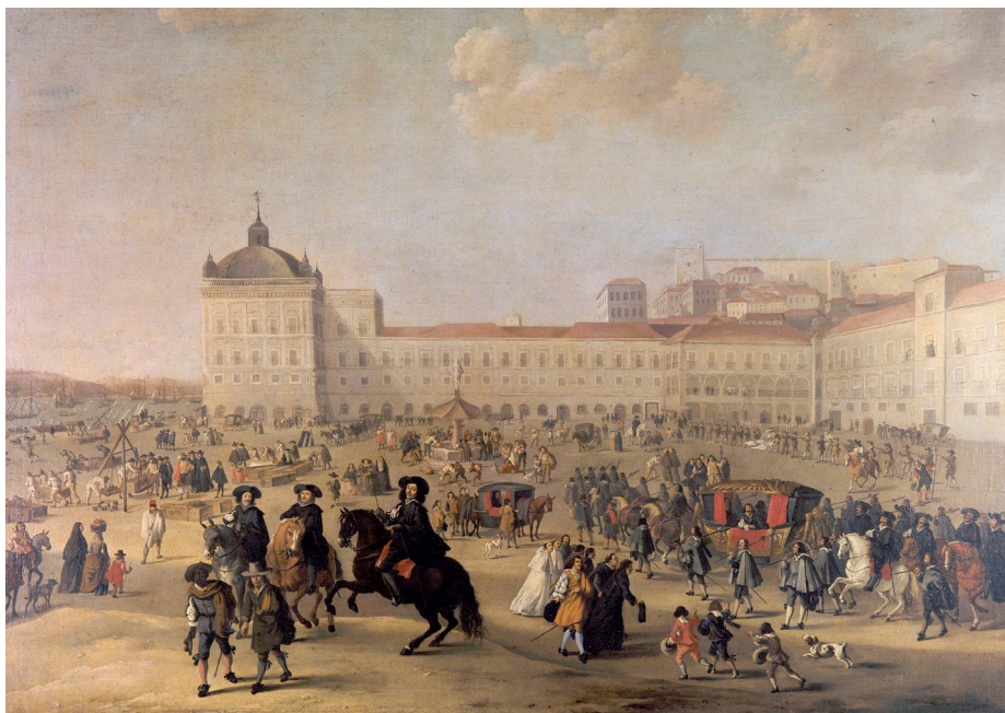
Palatstorget med Ribeirapalatsen, Musikbibliotekets hemvist, 1662 (Dirk Stoop).

hans barndomsvän Rebelo – och kanske inte heller att förglömma – att han lyckades bevarade Portugals nationella oberoende.