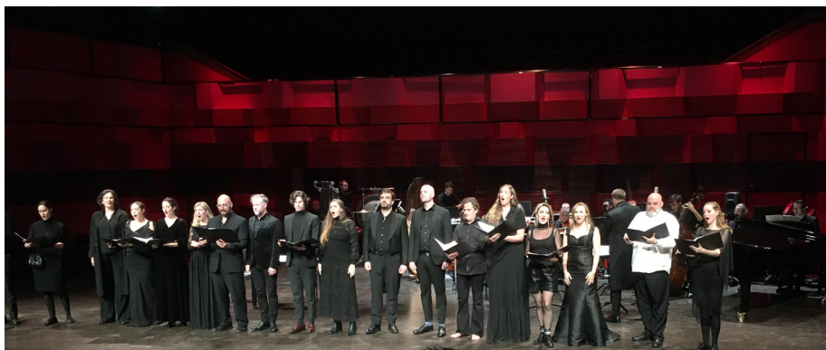
Sista numret på festkonserten var slutkören ur operan Stolthet och fördom av Daniel Nelson.

gjorde librettister, tonsättare, sångare, sångstudenter, representanter från Kulturrådet och Sveriges television, prefekter och rektorer för musikutbildningar, doktorander, operachef, musikvetare och dramaturger. Vi fick också lyssna till 16 musikinslag, med arior ur svenska operor av nio manliga och fyra kvinnliga tonsättare. Sångare och ackompanjatörer kom från Högsolan för scen och musik i Göteborg, Kungl. Musikhögskolan och från före detta Operahögskolan.