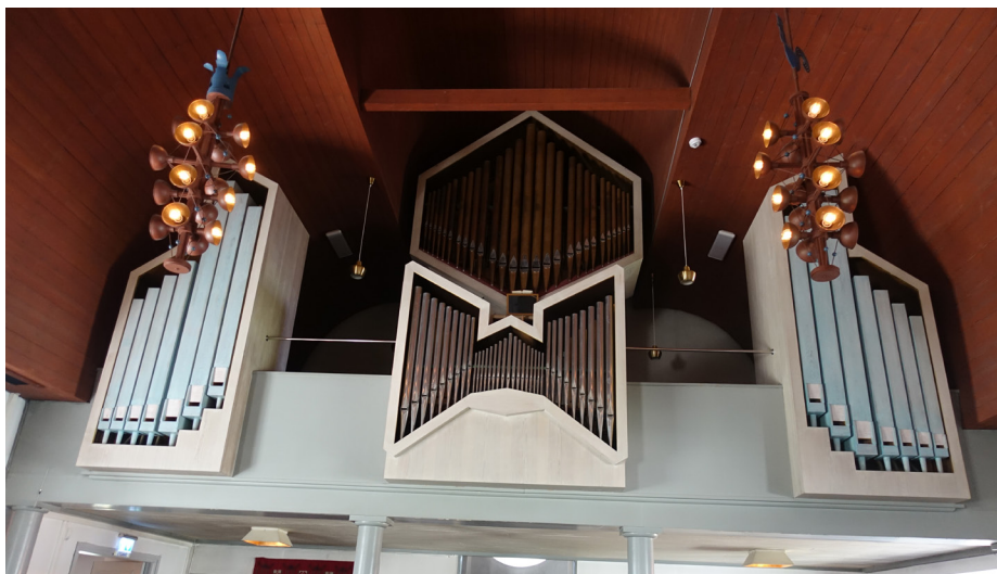
Läktarorgeln i Stora Sköndals kyrka har 27 stämmor och är byggd av Grönlunds orgelbyggeri

blir de psykoterapeuter. På alla tre stäl- lena finns bibliotek.