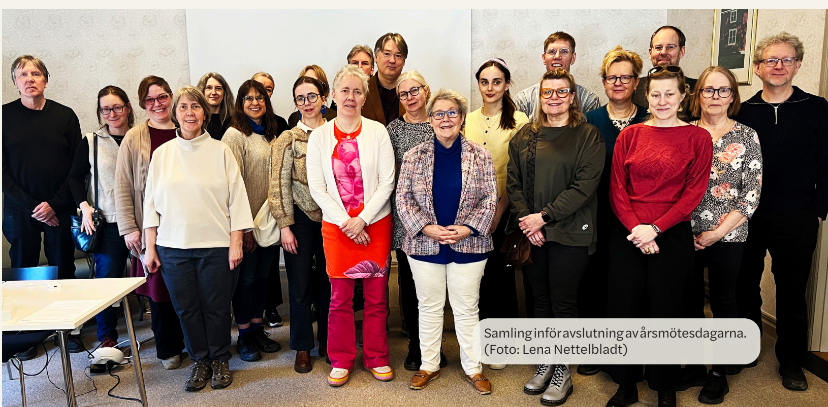
Samling inför avslutning av årsmötesdagarna.