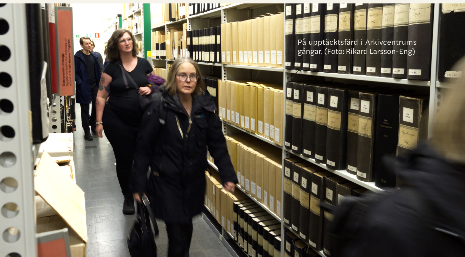
På upptäcktsfärd i Arkivcentrums gångar.

Det var en festlig premiärkväll – dessutom pyntad med kunglig glans då premiärföreställningen besöktes av kungen och drottningen. Strax innan den aviserade starttiden fick vi ställa oss upp till ackompanjemang av en trumvirvel, för att sedan sedan stämma in i »Kungsången« innan föreställningen tog sin början.