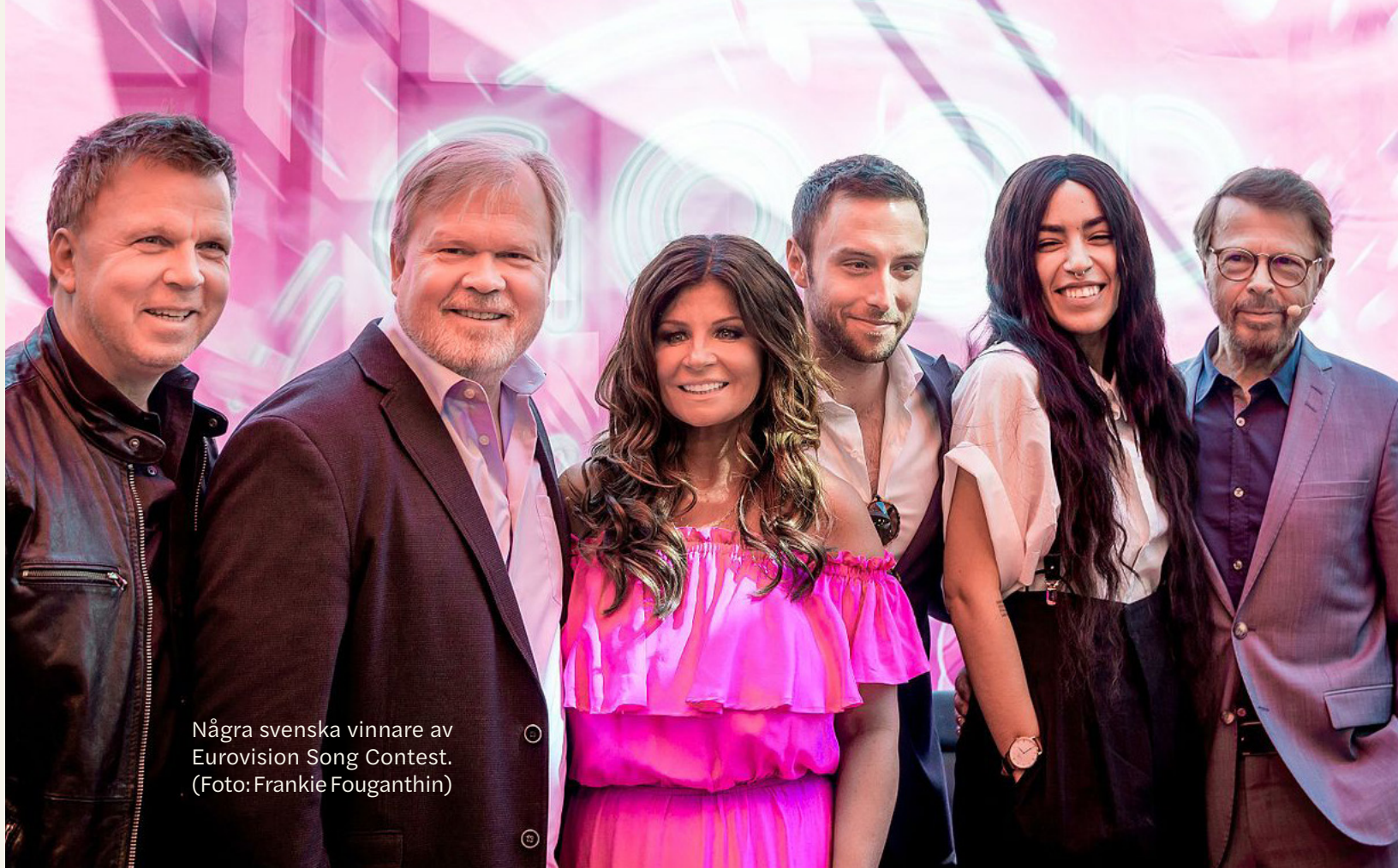
Några svenska vinnare av Eurovision Song Contest.

Hur kom låtarna med i tävlingen då? I början fick bara professionella kompositörer/låtskrivare skicka in låtar. 1967 fick alla skicka in låtar för första gången, och då kom det in 1800. Och så är det fortfarande, alla får skicka in, men några blir också särskilt inbjudna och kanske uppmanade. Det är inte helt lätt att få med en låt i melodifestivalen, varje år skickas cirka 1000 låter in. De flesta av låtarna är fortfarande skrivna av män. Men vi har Ingela Pling Forsman som kvalat in på topp fem listan med 39 (!) låtar sedan 1981.