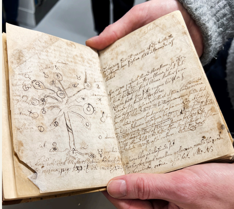
Carl von Linnés Örtabok från 1720-talet.