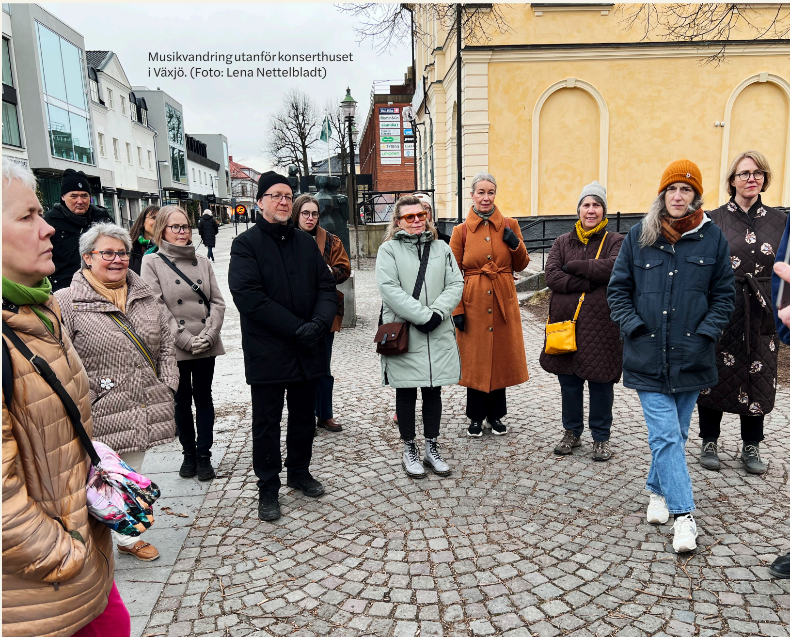
Musikvandring utanför konserthuset i Växjö.