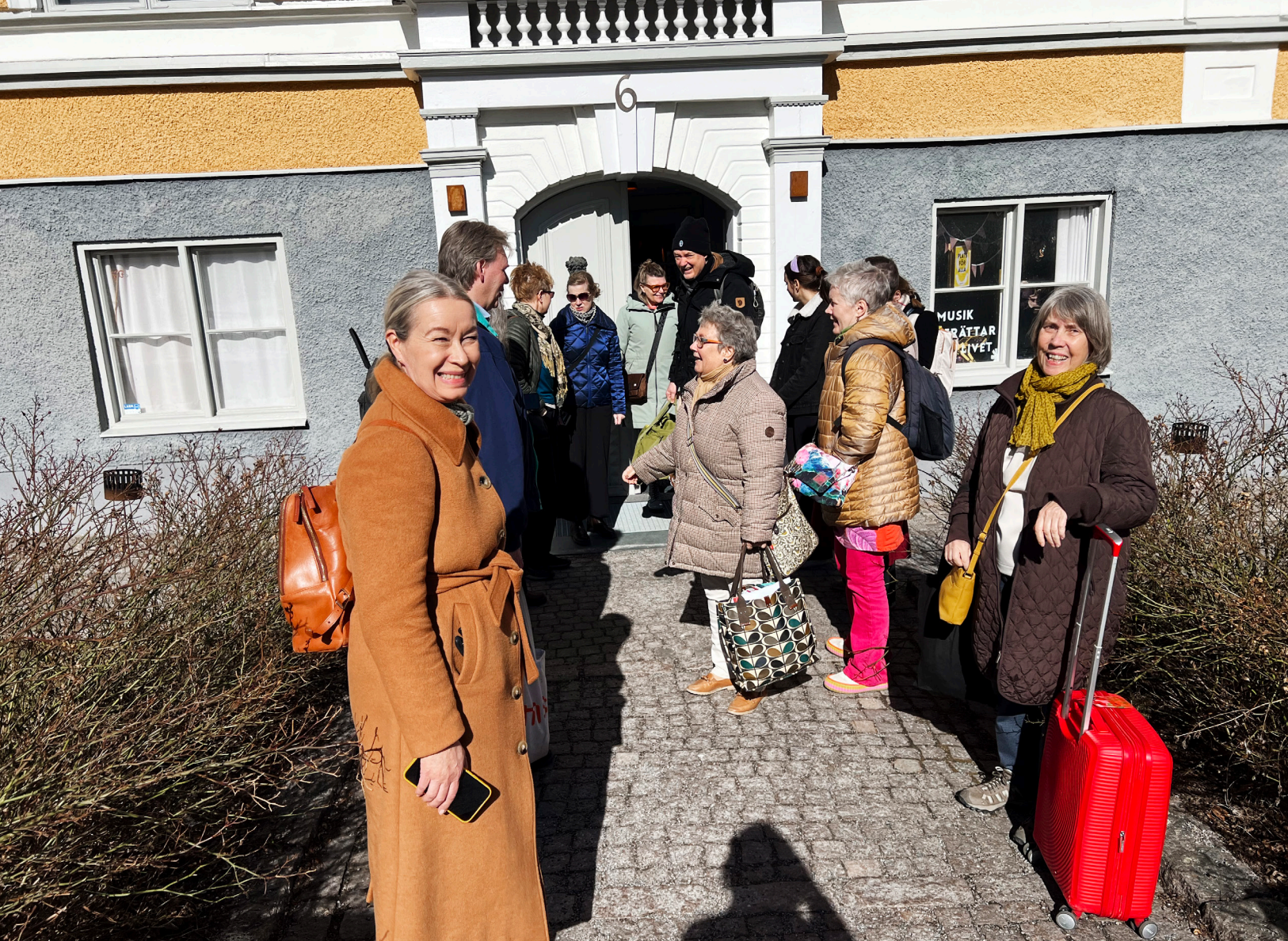
Samling inför avfärden från Växjö.